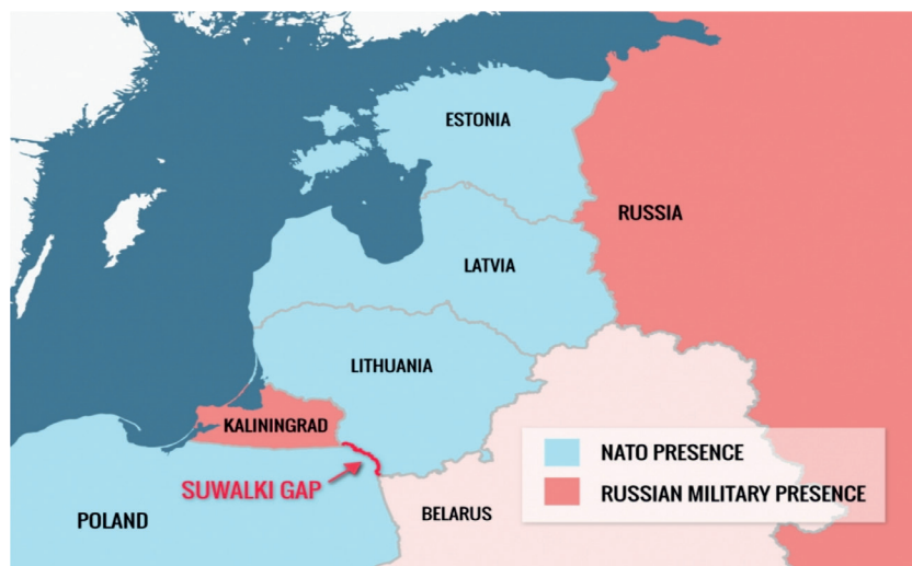
Figura nr. 2: Coridorul Suwalki

Coridorul Suwalki reprezintă o fâșie îngustă de 65 km în linie dreaptă, situat între enclava rusească Kaliningrad și Belarus, la granița dintre Polonia și Lituania. Este singura porțiune care leagă cele trei țări baltice de NATO pe cale terestră, prin intermediul a două drumuri înguste și al unei linii de cale ferată. Totodată, o amenințare asupra acestui coridor poate crea probleme serioase Alianței Nord-Atlantice în a-și apăra membrii de la Marea Baltică: Letonia, Estonia și Lituania.