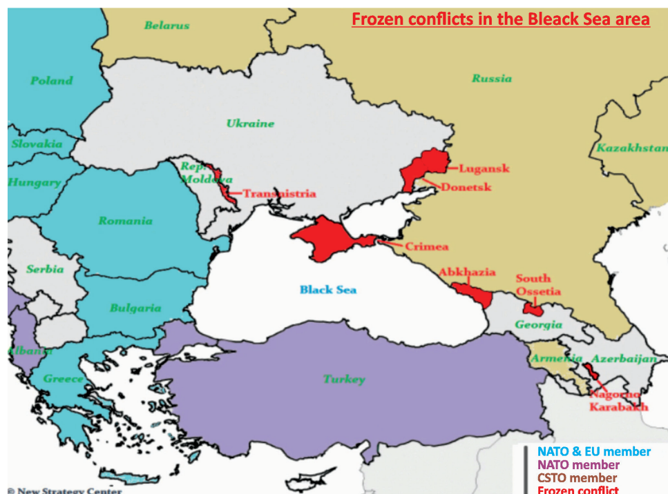
Figura nr. 1: Conflictelor înghețate din regiunea Mării Negre (New Strategy Center, Policy Paper, mai 2017, p. 5)

Riscurile și amenințările la adresa securității globale, dar și vulnerabilitățile actorilor din zonă derivă din fenomene asociate persistenței amenințărilor teroriste, continuării demersurilor privind separatismul pe criterii etnice, proliferării armelor de distrugere în masă, perpetuării conflictelor înghețate întreținute de Federația Rusă (ex. Nagorno-Karabah, Osetia de Sud, Abhazia, Donbas și Crimeea, Transnistria), fenomenului migrației ilegale, escaladării violenței (ex. curente de contestare ale măsurilor dispuse de autorități în contextul pandemiei generate de COVID-19), proliferării propagării știrilor false și amenințărilor de natură hibridă (figura nr. 1).