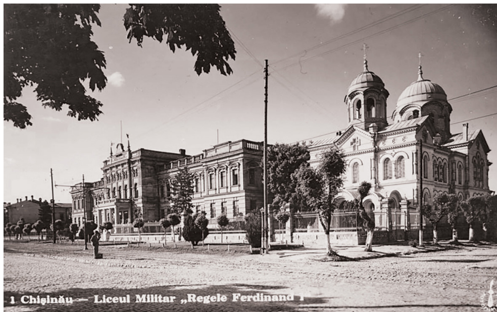
Liceul Militar „Regele Ferdinand I”