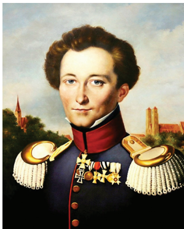
Carl von Clausewitz

Alarmată de victoriile devastatoare ale Franței asupra Austriei și Rusiei în 1805, Prusia s-a mobilizat pentru război în 1806. Încrezători în moștenirea lui Frederic cel Mare, căpitanul Clausewitz și majoritatea celorlalți ofițeri prusaci așteptau cu nerăbdare o luptă cu Franța. Momentul și punerea în aplicare a mobilizării prusace au fost însă deficitare, iar națiunea era insuficient pregătită din punct de vedere psihologic. Forțele prusace au fost spulberate în înfrângeri umilitoare în luptele de la Jena și Auerstedt. Două săptămâni mai târziu, acoperind retragerea a ceea ce a rămas din armata prusacă, Clausewitz și prințul August au fost capturați pe câmpul de luptă. În acordul de pace, Prusia și-a pierdut jumătate din populație și din teritoriul său și a devenit un satelit francez ocupat.