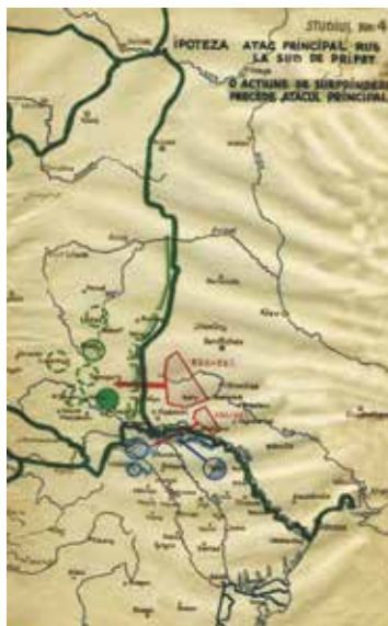
↑Foto 7: Studiul 4, Ipoteza Atac principal rus la sud de Pripet – o acțiune de surprindere precede atacul principal (AMNR, fond Marele Stat Major, Secția 3 Operații, dosarul 1120, p. 9).