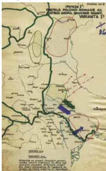
↓Foto 12: Studiul 6, Ipoteza I a , Varianta I, Forțele polono-române au distrus grupul secundar inamic (AMNR, fond Marele Stat Major, Secția 3 Operații, dosarul 1120, p. 26).

◀Ofensiva cu grosul forțelor polono-române contra flancului de Nord sau spatelui grupului principal inamic din Sudul Basarabiei, în legătură cu atacul de front care va fi declanșat de forțele române din Sudul Basarabiei