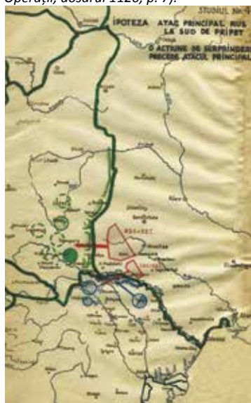
⬇Foto 5: Studiul 4, Ipoteza Atac principal rus la sud de Pripet – o acțiune de surprindere precede atacul principal (AMNR, fond Marele Stat Major, Secția 3 Operații, dosarul 1120, p. 7).