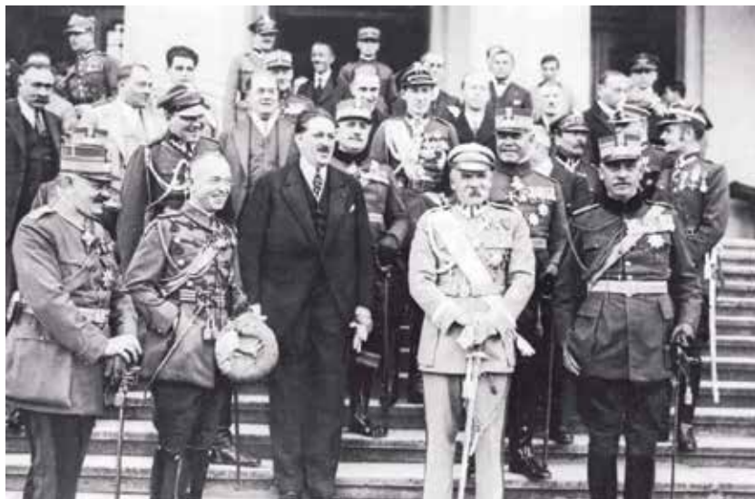
Foto 15: Mareșalul Pilsudski în timpul vizitei la București, în anul 1928. În stânga acestuia, generalul Angelescu, ministrul de Război al României, iar în dreapta, Jan Szembek, ambasadorul Poloniei la București

Între 19 august și 3 octombrie 1928, mareșalul Józef Pilsudski s-a aflat timp de șase săptămâni în vizită în România 72 . Ajungând la Târgoviște el a fost găzduit în vila doctorului Lucjan Skupiewski (străbunicul regretatului președinte polonez Lech Kaczyński și a fratelui său geamăn, Jarosław Kaczyński). În această călătorie, mareșalul Pilsudski a fost însoțit de către Ludwig Włodzimierz, atașatul militar al Poloniei la București, precum și de fiicele sale Wanda, de unsprezece ani, și Jagoda, de opt ani 73 .