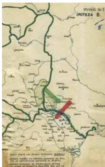
⬆Foto 3: Studiul 1, Ipoteza B.

◀IPOTEZA C Rușii atacau cu grosul la Nord de Pripet, Polonia: Grosul forțelor de intervenție române va lua ofensiva în direcția generală Smerinka-Berdicev IPOTEZA D Rușii atacă în același timp Polonia și România - Armatele aliate se vor ajuta reciproc, potrivit situației și forțelor disponibile.