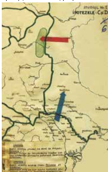
⬇Foto 4: Studiul 1, Ipotezele C și D (AMNR, fond Marele Stat Major, Secția 3 Operații, dosarul 1120, p. 6).

◀IPOTEZA C Rușii atacau cu grosul la Nord de Pripet, Polonia: Grosul forțelor de intervenție române va lua ofensiva în direcția generală Smerinka-Berdicev IPOTEZA D Rușii atacă în același timp Polonia și România - Armatele aliate se vor ajuta reciproc, potrivit situației și forțelor disponibile.