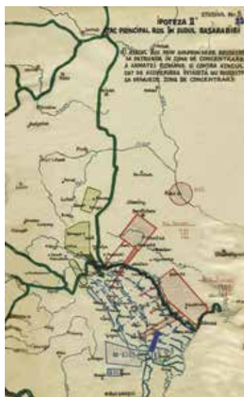
↑Foto 11: Studiul 5, Ipoteza II a Atac principal rus în nordul Basarabiei (AMNR, fond Marele Stat Major, Secția 3 Operații, dosarul 1120, p. 22).

Atacul rus prin surprindere reușește să pătrundă în zona de concentrare a armatei române și contraatacul dat de acoperirea întărită nu reușește să degajeze zona de concentrare