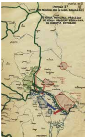
↑Foto 10: Studiul 5, Ipoteza II a Atac principal rus în nordul Basarabiei (AMNR, fond Marele Stat Major, Secția 3 Operații, dosarul 1120, p. 18).

Atacul rus prin surprindere reușește să pătrundă în zona de concentrare a armatei române și contraatacul dat de acoperirea întărită nu reușește să degajeze zona de concentrare