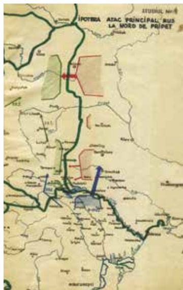
↑Foto 6: Studiul 4, Ipoteza Atac principal rus la nord de Pripet (AMNR, fond Marele Stat Major, Secția 3 Operații, dosarul 1120, p. 8).