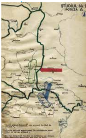
◀Foto 2: Studiul 1, Ipoteza A (AMNR, fond Marele Stat Major, Secția 3 Operații, dosarul 1120, p. 4).

➔Rușii atacă – cu grosul forțelor – România - Armata română va rezista succesiv pe Nistru și obstacolele paralele cu Nistrul; - Grosul forțelor de intervenție polone va ataca pe direcția Smerinka sau mai la Sud.