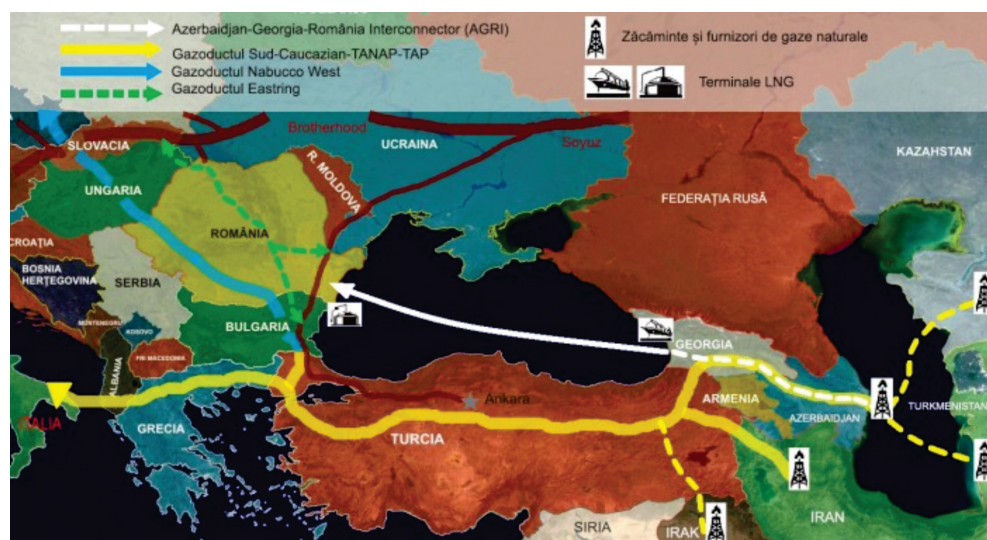
Figura nr. 8: Principalele trasee ale gazoductelor din Regiunea Extinsă a Mării Negre 59

Problemele de securitate din ZEMN și Orientul Mijlociu trebuie abordate integrat, ca aparținând aceluiași complex de securitate – Marea Neagră, cu două probleme distincte.