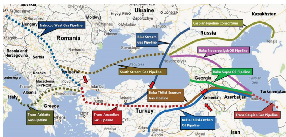
Figura nr. 5: Conductele de gaze naturale existente sau planificate spre Europa 47

de securitate a Rusiei în ZEMN este asigurarea transportului, prin conductele proprii, al resurselor energetice din Asia Centrală și Caucaz, aplicând șantajul energetic atât producătorilor, cât și consumatorilor.