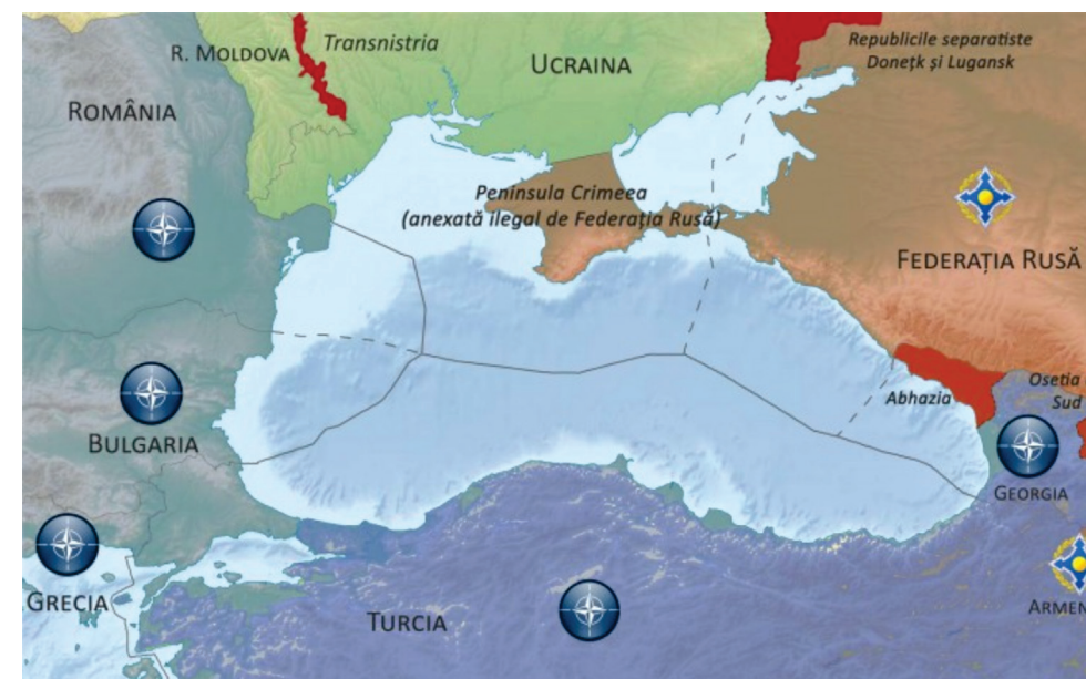
Figura nr. 1: Zona Extinsă a Mării Negre 9

a intereselor manifestate, referitoare la acest spațiu. Prin urmare, putem afirma că Zona Extinsă a Mării Negre (ZEMN) include arealul dintre Munții Balcani și Marea Caspică și a devenit unul dintre cele mai dinamice zone din perioada post-Război Rece și post-sovietic 8 .