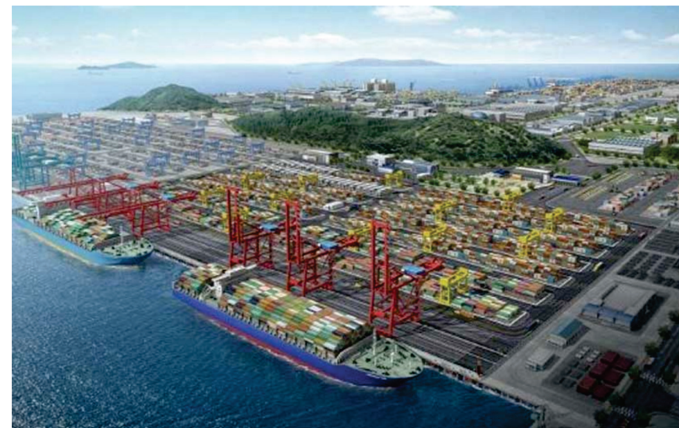
Figura nr. 4: Anaklia, Georgia, Punct de tranzit TCITR

Indiferent de acțiunile pe care China le are sau le-ar putea planifica în imediata vecinătate, s-a distanțat de Rusia și aventurile sale militare. Totuși, în contextul actual, și-a intensificat și acțiunile militare navale în spațiul ZEMN (2017 este anul când, pentru prima dată în istorie, China a participat la exercițiul naval în Marea Neagră, în cooperare cu Rusia). Totodată, China a inițiat un proiect de dezvoltare a infrastructurii portuare de mare adâncime, în Anaklia, Georgia, ca punct de tranzit pe TCITR, care să reducă toate costurile și care să asigure exploatarea oportunităților de dezvoltare economică regională 40 . Construcția și exploatarea acestui port au fost încredințate unui consorțiu internațional în 2016, format din companii din SUA, Marea Britanie, Georgia, Kazahstan și Bulgaria. Planurile prevăd ca acest port să devină operațional în 2020.