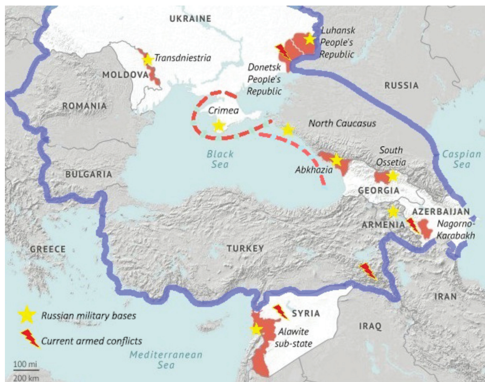
Figura nr. 2: Principalele focare de instabilitate din ZEMN (Centura instabilității de la Marea Neagră) 19

crimei organizate; implicarea unor lideri politici și militari în acțiuni ilegale etc.), de natură economică și socială (criza statelor și lipsa sau ineficiența reformelor; existența unor decalaje mari între state; nivel de trai scăzut; emigrații și imigrații de masă), de natură securitară (mișcări separatiste, dispute teritoriale, insecuritatea frontierelor, existența unor cantități mari de armamente și muniții aflate la limita termenului de păstrare, insuficiente măsuri de securitate a acestora) 20 .