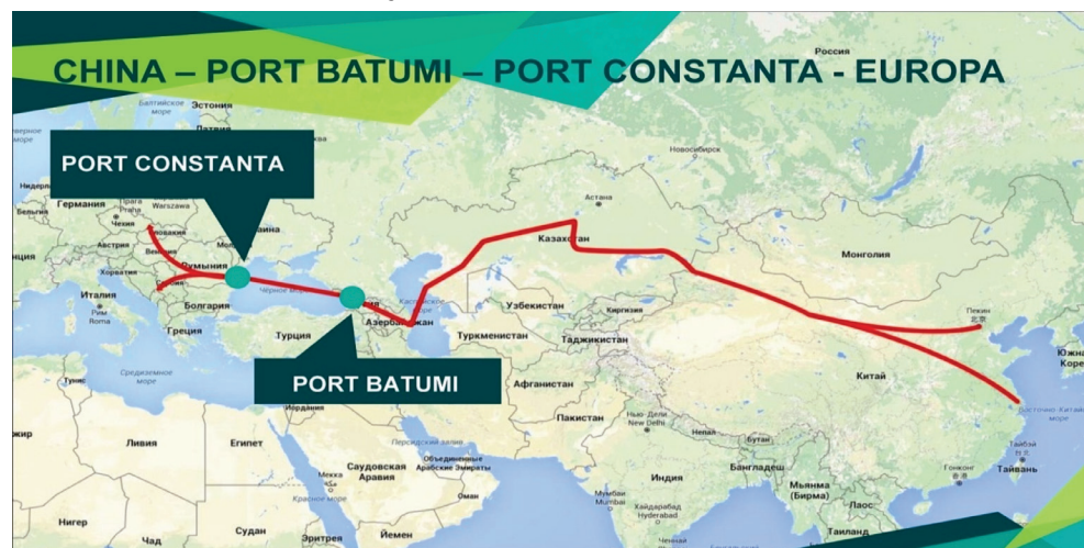
Figura nr. 3: „Ruta de Transport Internațional Transcaspică” 39

În timp ce comunitatea internațională era atentă la acțiunile strategice ale Rusiei, în ZEMN a început să-și extindă influența, în mod insidios și subtil, un actor care nu aparține spațiului euroatlantic, ci celui asiatic: China. Având ca punct de plecare promovarea propriilor interese, China a identificat oportunități considerabile în regiune, care constituie parte a conceptului trans-urasiatic „One Belt, One Road”. Prima parte a ambițiosului proiect „Ruta de Transport Internațional Transcaspică” (TCITR), care leagă China de Kazahstan, Azerbaidjean, Armenia, Georgia și, în continuare, în Europa, a fost finalizată în august 2015. Această rută include 4.000 km de cale ferată, cu capacitatea de transport care, în 2020, va avea 13,5 milioane de tone de mărfuri și 300.000 de containere 38 .