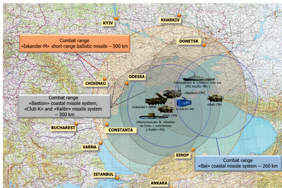
Figura 4: Raza de acțiune a capabilităților rusești dislocate în zona Mării Negre 7

Peninsula Crimeea a fost deja ocupată de Rusia, iar regiunea Donbas este încă ocupată de forțe separatiste pro-ruse. Principala rută de aprovizionare a forțelor ruse din Siria trece prin Marea Neagră, via Bosfor și Dardanele. În Caucaz, conflictele dintre Armenia și Azerbaidjan asupra regiunii Nagorno-Karabah și dintre Georgia și regiunile separatiste Osetia de Sud și Abkhazia continuă să atragă interesul altor puteri, în frunte cu Rusia. Diferențele istorice și tensiunile etnice pot fi folosite de Rusia ca mijloace de a se amesteca în afacerile interne ale statelor și a pune presiuni asupra guvernelor din regiune pentru a se alinia politicii Moscovei. Prin deturnarea unor membri ai NATO din regiune, Kremlinul poate slăbi coeziunea internă a Alianței și submina credibilitatea acesteia.