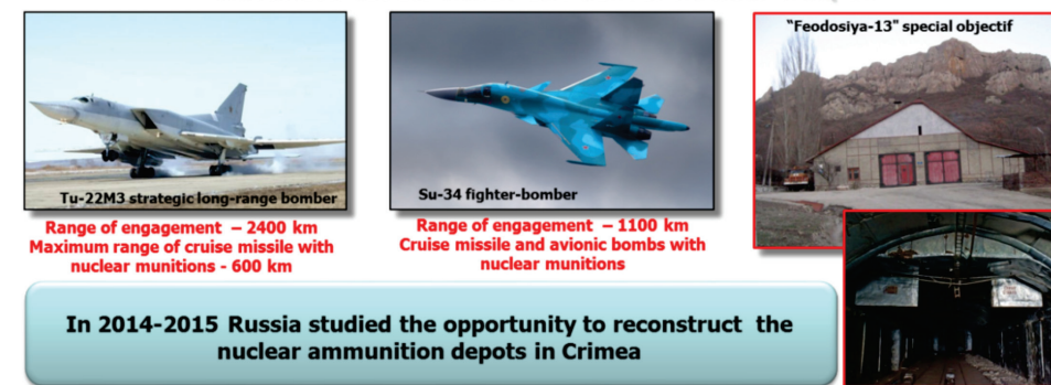
Figura 3: Capabilitățile A2AD ale Rusiei în zona Mării Negre 6

La începutul lui martie 2015, Putin a sugerat ca Moscova să disloce arme nucleare în Crimeea. Rachetele balistice tactice Iskander (atât în varianta convențională, cât și în cea nucleară) au o rază de acțiune de 400 de kilometri și pot atinge întreaga parte de sud-est a Ucrainei (inclusiv orașele industriale Odessa, Krivyi Rih și Dnipropetrovsk), o mare parte din Moldova, întreaga zonă de coastă a României și o parte semnificativă din coasta Turciei la Marea Neagră. Putem spune că Moscova, de fapt, își dezvoltă capacitățile pentru a „sechestra” Marea Neagră și a-și descuraja potențialii adversari să intre în această zonă și să încerce să contracareze ofensiva Rusiei.