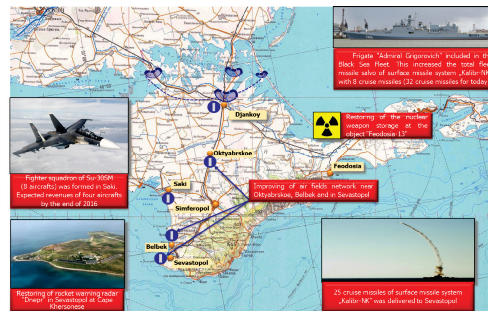
Figura 1: Rusia își îmbunătățește infrastructura militară în Peninsula Crimeea 4

În Marea Neagră, Crimeea a devenit principala platformă a Rusiei pentru executarea operațiilor A2AD. Astfel, au fost dislocate în peninsula sisteme de apărare avansate, cum ar fi sistemul de rachete anti-navă Bastion-P, înzestrat cu rachete de croazieră P-800 Oniks, împreună cu sistemele de rachete sol-aer S-300 și S-400 Triumf. De asemenea, sunt în derulare programe de modernizare a buncărelor din era sovietică, de reanimare a sistemelor de radare de avertizare timpurie și instalarea de echipamente de război electronic moderne. Împreună cu sistemele de rachete ale Rusiei din Armenia, Krasnodar și Latakia, capacitățile A2AD ruse se extind asupra unei mari părți a zonei, acoperind aproape în totalitate suprafața Mării Negre și părți din Moldova, România, Georgia, Turcia și Ucraina.