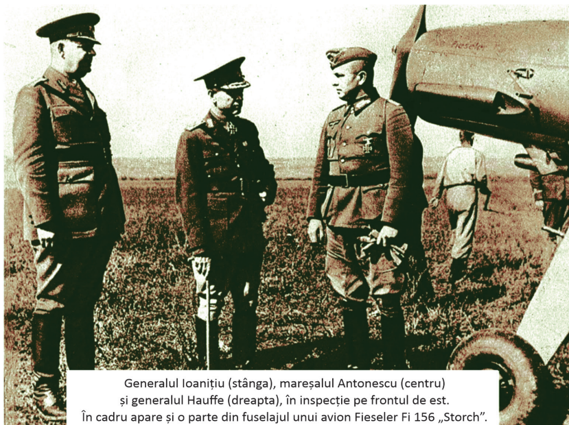
Generalul Ioanițiu (stânga), mareșalul Antonescu (centru) și generalul Hauffe (dreapta), în inspecție pe frontul de est. În cadru apare și o parte din fuselajul unui avion Fieseler Fi 156 „Storch”.

ambii la Baden, unde se afla postul de comandă înaintat al Armatei 4 care conducea operațiile asupra Odesei. Ambii se dau jos din avioane, iar Ioanițiu, mergând spre Mareșal pe drumul cel mai scurt, a trecut pe sub elicea avionului său, care se oprise complet din mișcare. Când însă a ajuns sub elice, un rest de gaze i-a mai dat acesteia un impuls și elicea, începând instantaneu o învârtire violentă, a lovit puternic pe Ioanițiu în cap, acesta căzând jos și decedând după puțin timp”.